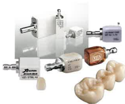
* 写真出典 : Ivoclar Vivadent